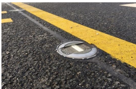
Ilustračné foto DOPRAVNÉHO LED GOMBÍKA PRG.LED

Na kotvenie svietidla sa používajú špeciálne lepidlá a tmely, ktorých teplota spracovania a tuhnutia je obvyčajne min. 5-10 C°.